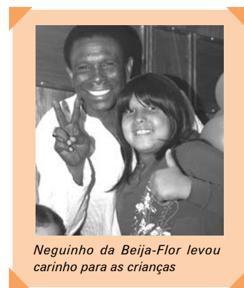
Neguinho da Beija-Flor levou carinho para as crianças

Nas outras unidades assistenciais, decoradas com motivos natalinos, também teve festa e distribuição de presentes para os pacientes. Eles receberam kits com produtos de beleza e de higiene e toalhas, entre outros. Além disso, houve música, sorteios e apresentação de corais. ■